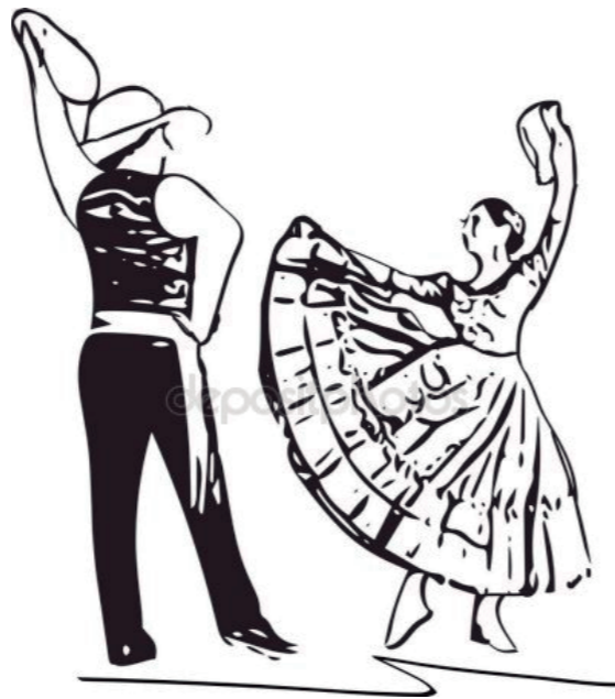
Piedra y camino Zamba Letra y música Atahualpa Yupanqui