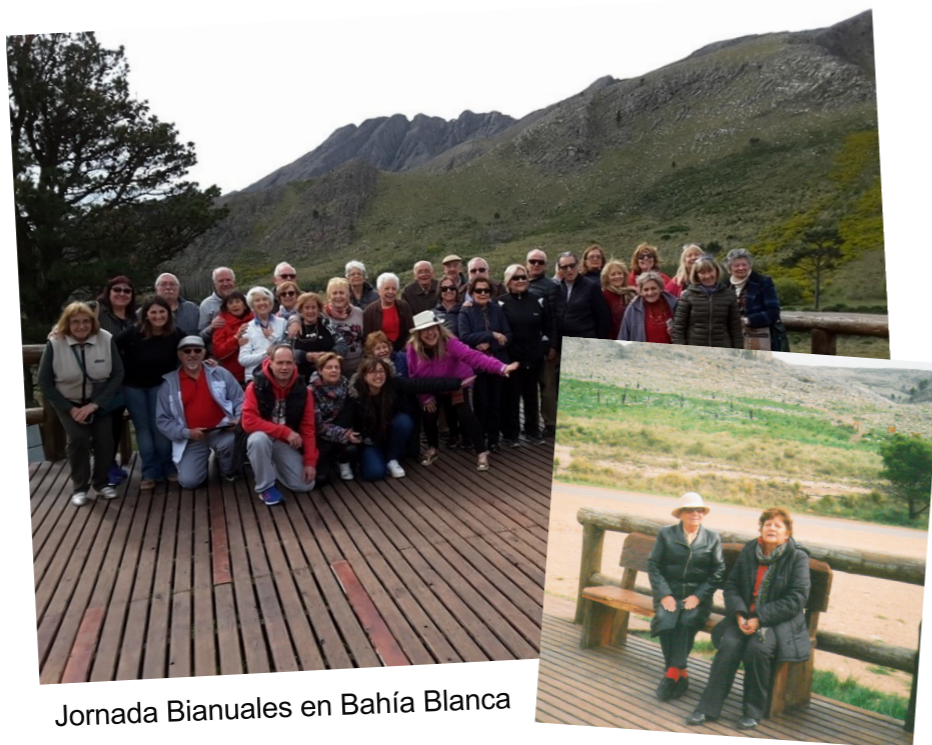
Jornada Bianuales en Bahía Blanca